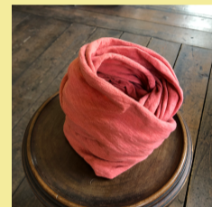
インドアカネ鴉色 （ピンク）

好きな布アイテムを持参し染めます。色は第1回目の講座時に黄色系・グレー系・藍染の中から参加者全員で決めたものを使用します。