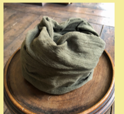
ヤマモモの海松色 （カーキグリーン）