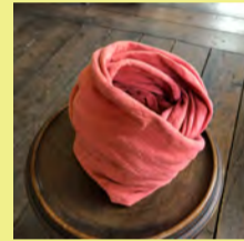
インドアカネ鴉色 （ピンク）

インドアカネ鴉色（ピンク）とヤマモモの海松色（カーキグリーン）どちらか好きな色を申込時に選択し、tezomeyaのオーガニックスヌードを染めます。