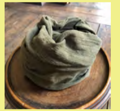
ヤマモモの海松色 （カーキグリーン）