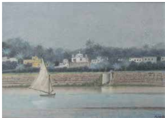
金曾 大畔「ナイル河のほとり」