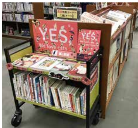
5月の「猫アート」特集

館内中央閲覧席横の「美術特集コーナー」では、関西を中心に日本で開催される美術展の関連資料を紹介しています。6月は「クマのプーさん」を展示しています。『クマのプーさん』は、1926年に出版されて以降、50カ国以上の言語に翻訳され、5,000万部以上の本が出版されている、世界一有名なクマの物語です。特集コーナーでは、日本語版と英語版の「プーさん」の物語と詩集を中心に関連図書を展示しています。物語を書いたA. A. ミルンとイラストを描いたE. H. シェパードの関連本や「プーさん」のモデルになったクマの絵本などもありますので、誕生秘話など、プーさんをもっと深く知りたい方にもおすすめです。