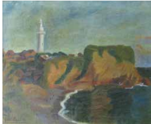
斎藤与里「志摩波切風景」