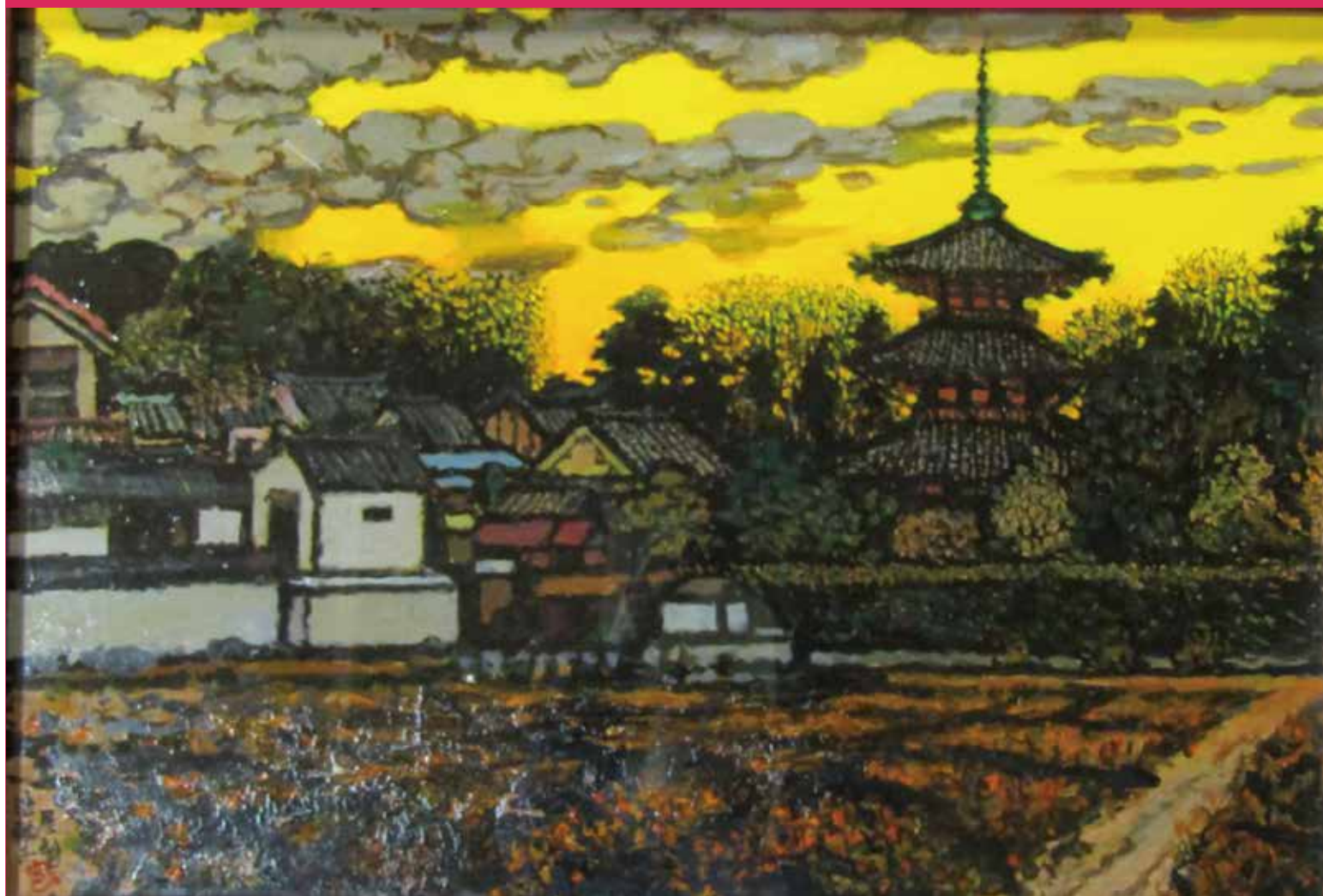
野沢 寛「斑鳩法輪寺展望」