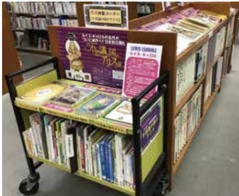
4月の「不思議の国のアリス」特集

館内中央閲覧席横の「美術特集コーナー」では、関西を中心に日本で開催される美術展の関連資料を紹介しています。5月は「猫アート」を展示しています。