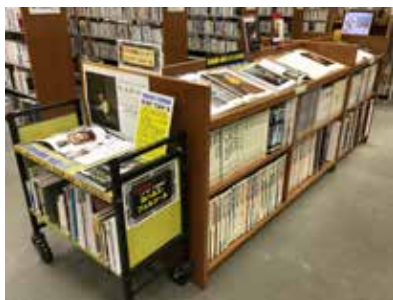
3月の「フェルメール」特集

館内中央閲覧席横の「美術特集コーナー」では、これまで、世界と日本の巨匠たちを順に紹介してきましたが、4月からは、関西を中心に日本で開催される美術展の関連資料を紹介していきます。4月は「不思議の国のアリス」を展示しています。